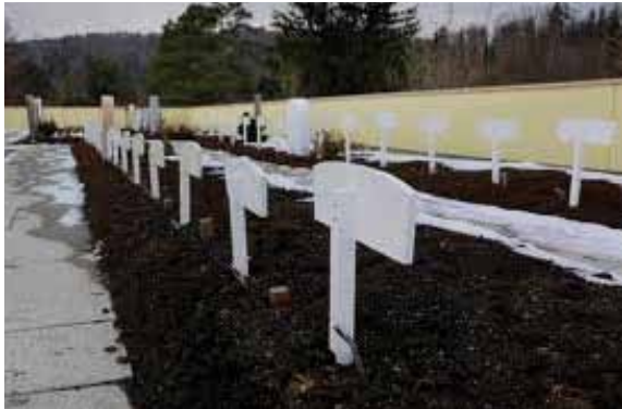
مقبرة زيورخ فيتيكون، مدينة زيورخ

يجب تعريف كل قبر بعلامة (شاهدة)، سواء المحتوى أو الحجم يحتاج إلى موافقة مسؤول المقبرة عليها. من الممكن أن تكون لوحة كتابية بسيطة، تحتوي على الأقل على الإسم وسنة الولادة والوفاة وبالأحرف اللاتينية.